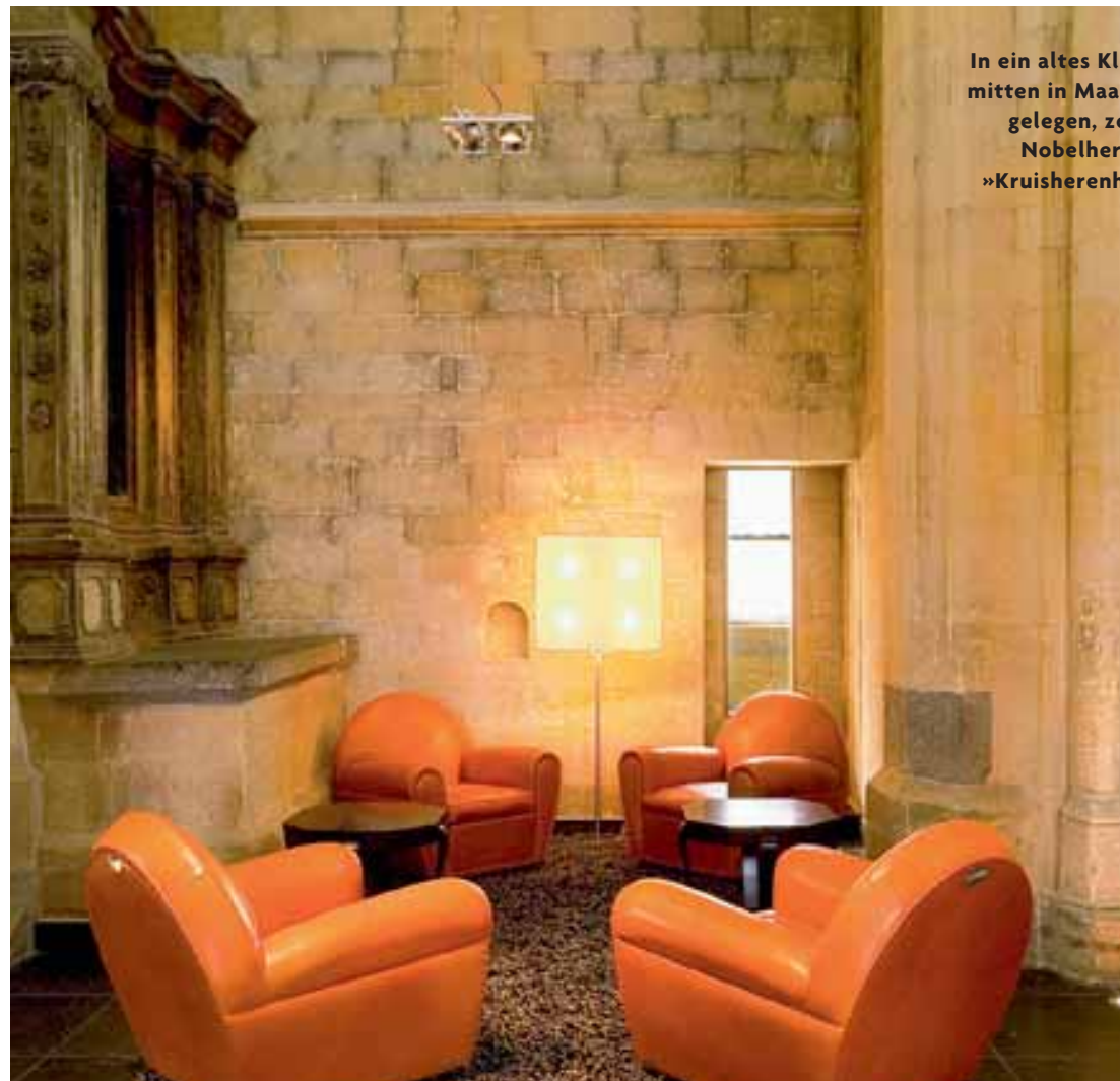
In ein altes Kloster mitten in Maastricht gelegen, zu dem der Nobelpreis für »Kruisherenhotel«

strahlen nach, die bunte Lichtkegel an die backsteinroten Mauer werfen. Dann läuft er prüfend an einem Fresco, das gerade restauriert wird. Nähert sich er ein Kurzsichtiger dem Wandgemälde bis auf wenige Zentimeter; verharrt eine Weile in gebückter Haltung, nickt zufrieden und schreitet dann in einem flüchtigen Tempo rückwärts, die meterhohe Farbe lange nicht aus den Augen lassend, in den Verkaufsräumen zurück. Er ist stolz darauf, dass durch den Umbau wertvolle Motive aus vergangenen Zeiten entdeckt wurden und nun restauriert werden können. Dieses Wandgemälde aus dem 14. Jahrhundert, das Thomas von Aquin darstellt, mag besonders.