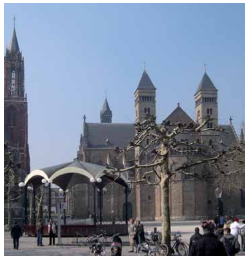
In Maastrichts 53 Kirchen wurden die schon vor 200 Jahren entweiht

Camille Oostwegel wollte durch die besondere Architektur und Stimmung Gewohnheiten schaffen und eine veränderte ästhetische Spannung erzeugen. Dafür ließ er im einstigen Kirchenschiff einen modernen Aufzug bauen, der Bewegung in den Innenraum bringen soll, ihn dynamisiert, wie er bezeichnet; und mit dem man bis in die Le-