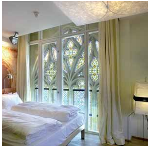
Wenn Hotelzimmer auf Kirchenarchitektur trifft, kommt diese famose Aussicht raus